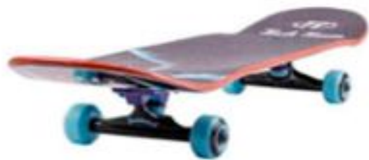
Скейтборд/ электрический скейтборд