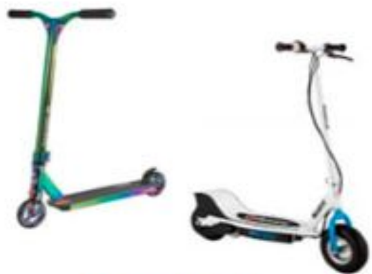
Самокат/ электрический самокат